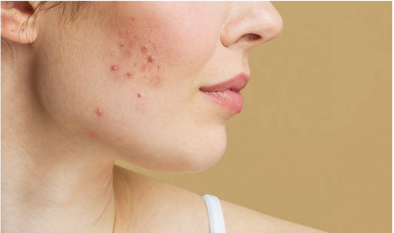
(Symbolbild mit Fotomodel)

Viele junge Menschen leiden unter entzündlicher Akne und den daraus entstehenden Narben.