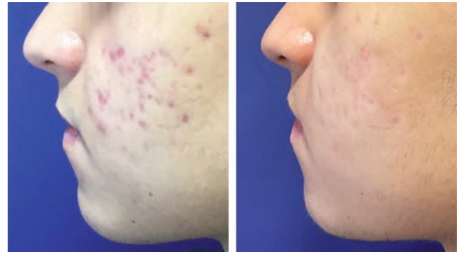
3 Patient bei Erstvorstellung in der Klinik (links) und nach einer Behandlungssitzung (rechts)

In unserer Praxis kombinieren wir frühzeitig die anti-entzündliche SWT®-IPL-Therapie mit dem nicht ablativen fraktionierten Laser Frax 1550™ und erzielen hiermit eine rasche Verbesserung der Entzündungen und der Hauttextur. Trotz